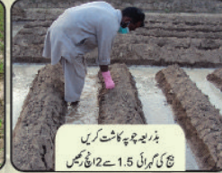
بذریعہ چوپہ کاشت کریں بج کی کھراہ 1.5 سے 12 انچ رکھیں

پہلا پانی کاشت کے 3 سے 5 دن کے اندر لگائیں۔ پھر موسم کو مد نظر رکھتے ہوئے ہفتہ وار آبپاشی کریں۔