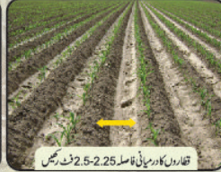
قطاروں کا درمیانی فاصلہ 2.25-2.5 فٹ رکھیں