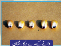
دانے کے سرے پر کالانشان

جب چھلیوں کے پردے خشک ہو جائیں اور دانے کے سرے پر کالانشان نظر آنے